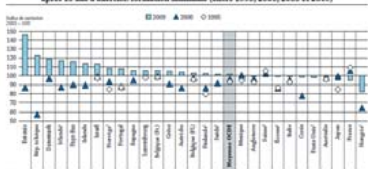
Graphique D3.2. Évolution du salaire des enseignants du premier cycle du secondaire après 15 ans d'exercice/formation minimale (entre 1995, 2000, 2005 et 2009)

1. Salaire réel. 2. Salaire après 15 ans d'exercice. Les pays sont classés par ordre décroissant de l'écart de salaire, entre 2005 et 2009, du salaire des enseignants du premier cycle du secondaire après 15 ans d'exercice. Source : OCDE, Tableau D3.2. Voir les notes à l'annexe 3 ( http://www.oecd.org/dataoecd/2/1/47822222.pdf )