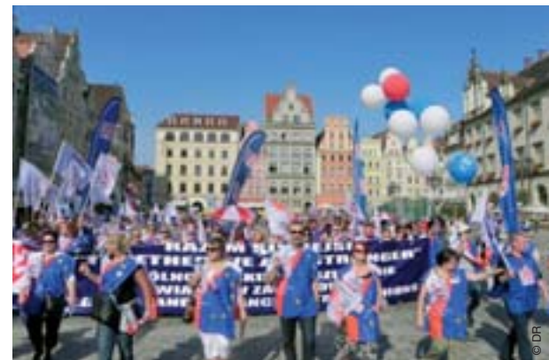
Euromanif à Wroclaw (Pologne)

Les décisions prises par les gouvernements vont à l'envers de ce que disent les forces sociales partout en Europe. Il ne doit plus s'agir de rassurer les marchés (qui aggravent eux-mêmes la situation), de donner des gages aux agences de notation dont on voit bien qu'elles créent elles-mêmes les spéculations qu'elles dénoncent ensuite, mais de les désarmer. Il faut promouvoir des types d'entreprises qui